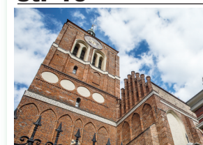
Historia nieznaną św. Jana oraz NCK. str 12-13