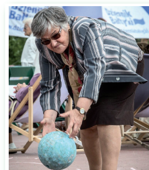
Jak integrowali się seniorzy podczas 4 Pomorskiego Pikniku w Gdańsku str 6